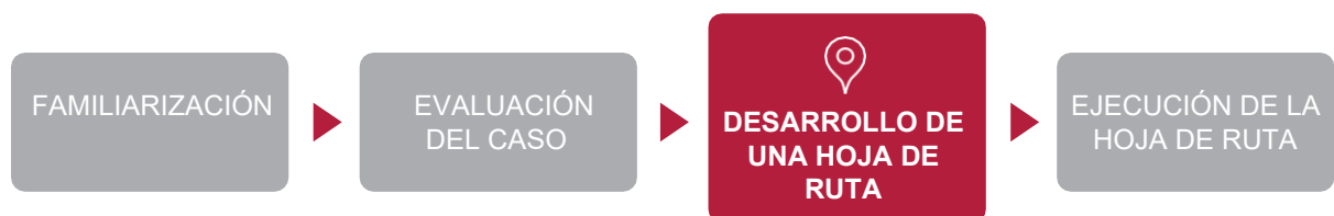
Figura 1—Fases ilustrativas del camino jurisdiccional hacia la adopción u otro uso de las Normas del ISSB